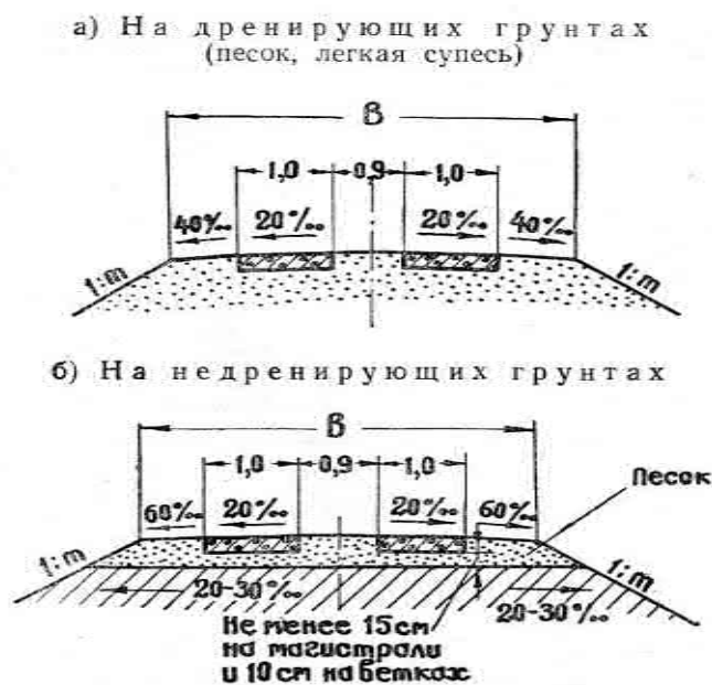
Рисунок В.1 Для однополосных лесных дорог

В.1 Поперечные профили приведены на рисунках В.1, В.2.