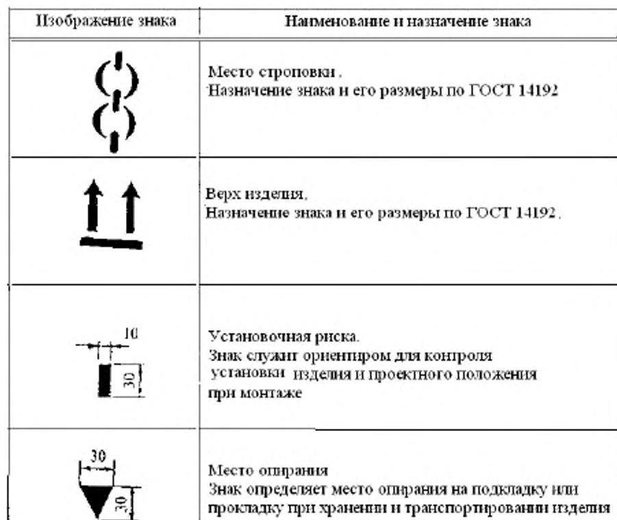
Т а б л и ц а 7 – Монтажные знаки

7.5 В стандартах, технических условиях и рабочей документации на изделия конкретных видов допускается предусматривать применение маркировочных надписей и знаков, не упомянутых в 7.3 и 7.4.